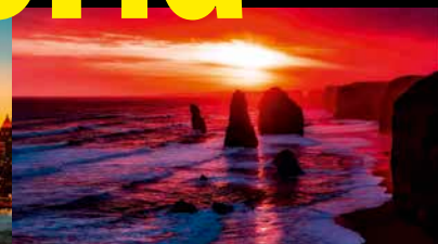
Percy A. Grainger – Colonial Song